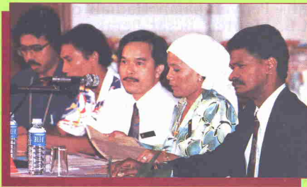
Para Juri yang bertugas mengadili perjalanan Kviz.