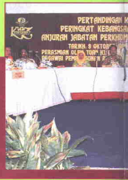
Pertandingan Kviz Kenegaraan Peringkat Kebangsaan 1994.